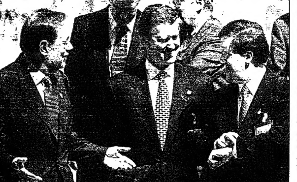
رئيس المجلس الامن الدولي... في اجتماع... في نيويورك...